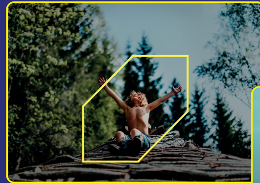
A NEW KIND OF WILDERNESS