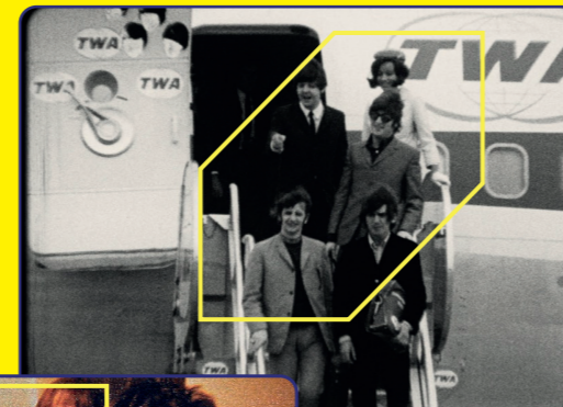
TWST - THINGS WE SAID TODAY

Ospiti a Firenze, per la prima assoluta del film Going Underground , gli antesignani del punk italiano e della Italo-disco: i Gaznevada!