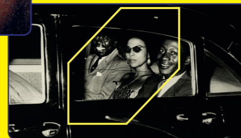
SOUNDTRACK TO A COUP D'ETAT